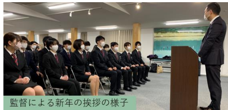
監督による新年の挨拶の様子

また、この日は近年力を入れているInstagramのリールを初投稿した記念すべき日です。2022年はよりSNSに力を入れて部の魅力を発信していきますので、我が部のInstagram(@d.shorinji)、Twitter(@dshorinji)をぜひご覧ください。