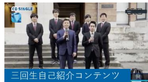
三回生自己紹介コンテンツ