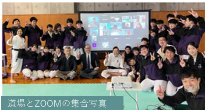
道場とZOOMの集合写真

次回はぜひ対面での懇親会に参加したいと思います。また、監督やコーチ、トレーナーの方には、貴重なお時間をさいて、部活に費やしてご指導頂き、本当にありがとうございます。これからも、よろしくお願ひ致します。(一回生 お母様)