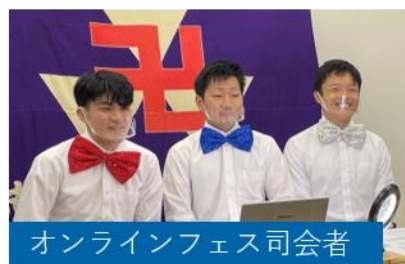
オンラインフェス司会者