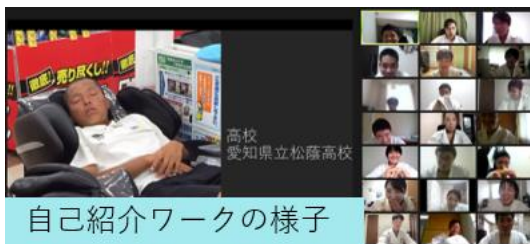
自己紹介ワークの様子

9月4日(土)のシーズンイン後、最初の行事としてZOOMを用いてオンラインで夏季強化練習会を行いました。