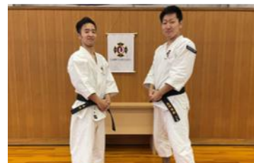
新旧主将ツーショット