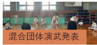
混合団体演武発表