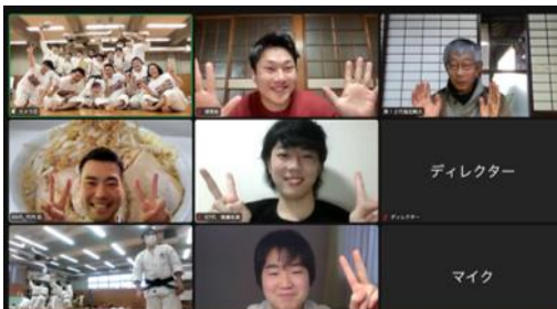
ZOOMでご参加いただいたOBの方々

第58代の方々にとって最後の練習となる、追い出し練習を開催しました。本来であれば、OB・OGの方々にも道場で追い出し練習にご参加いただきたかったのですが、まん延防止等重点措置期間中のため、人数を絞って行いました。その代わり初の試みとして、ZOOMで6名のOBの方々にご参加いただき、思い出ムービーの鑑賞や四回生の最後の挨拶などを中継しました。