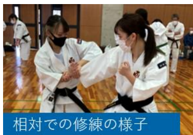
相対での修練の様子

オンラインフェスは、企画から本番まで現役とOB・OGが連携して作り上げた新たな交流スタイルで、まさに「チーム同志社」の真骨頂。今後は対面の懇親に戻しつつも、フェスのノウハウを活用して更に絆を深められる行事にしたいですね。