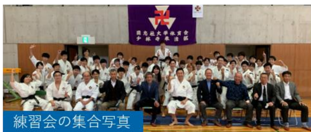
練習会の集合写真