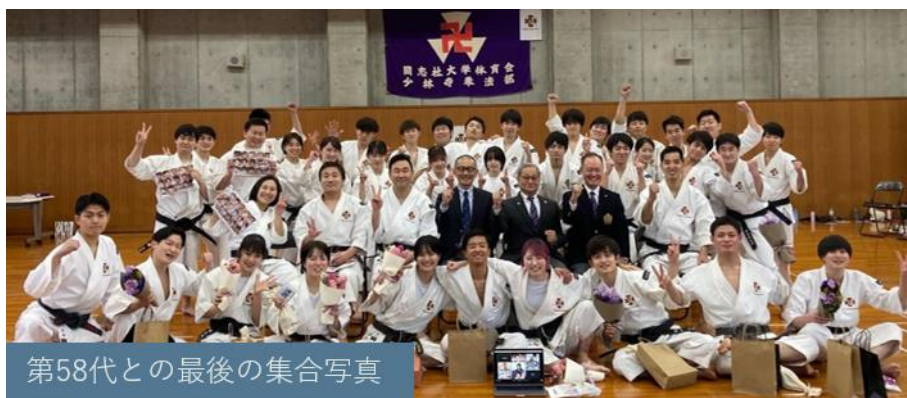
第58代との最後の集合写真

58代の皆様4年間本当にお疲れ様でした。そして、ありがとうございました。皆様のこれからの活躍を現役部員一同心から応援しております。