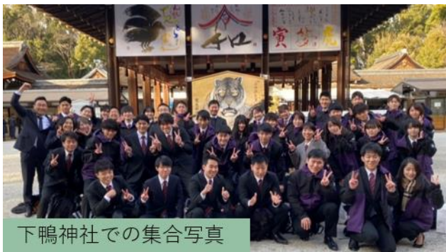
下鴨神社での集合写真

2022年最初の行事として「年始に際して新たな気持ちでチームの結束力を向上させ、また一年の部活動方針を共有して決意を新たにすること」を目的に新年の集いを実施しました。